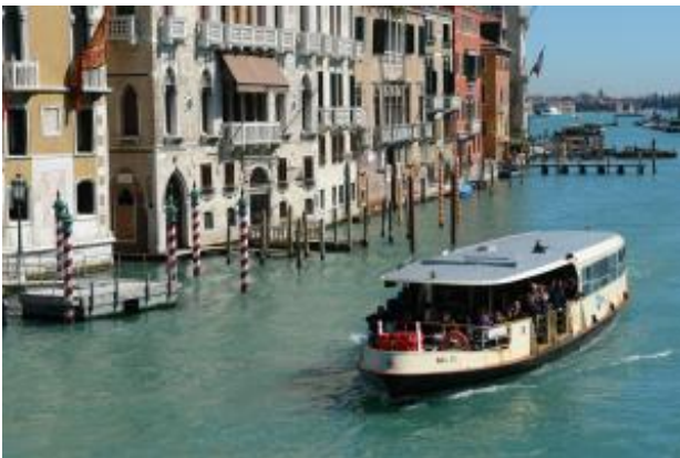
Canal Grande mit Vaporetto