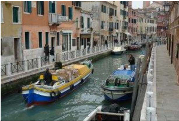
Kleine Kanäle und Gassen