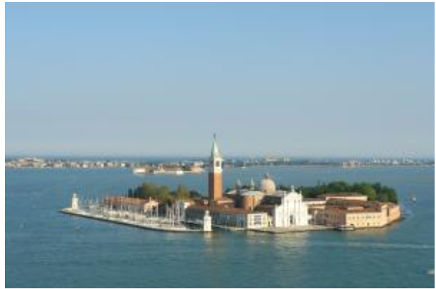
San Giorgio Maggiore