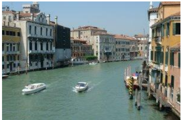
Canal Grande mit Wassertaxi