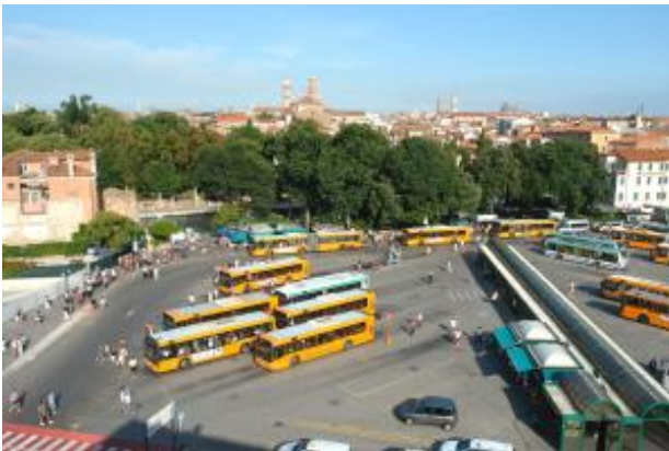
Busbahnhof am Piazzale Roma

Lesen Sie das kostenlose eBook Nr. 3 welches Ihnen den öffentlichen Nahverkehr mit den Vaporettos (alle Linien, alle Preise, Ticket Übersicht, etc.) genau erklärt.