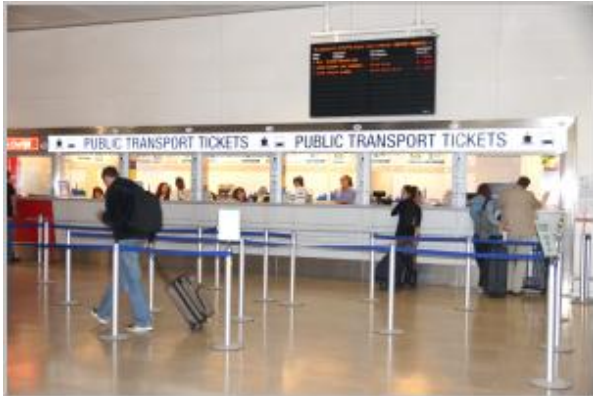
Der ACTV Schalter im Flughafen Gebäude

Im Flughafen Gebäude befindet sich sowohl ein Schalter der öffentlichen Nahverkehrs Gesellschaft Venedigs: ACTV als auch 2 Automaten.