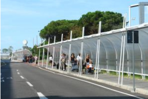
Überdachter Fußweg von Flughafen Gebäude bis zur Anlegestelle Ali Laguna