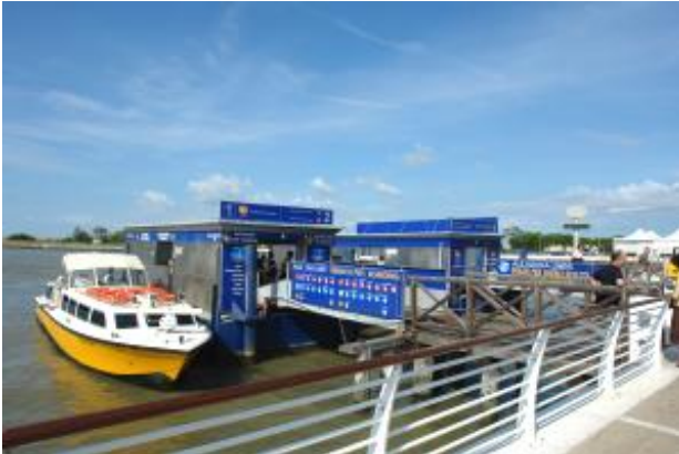
Die Haltestelle der Ali-Laguna am Flughafen Marco Polo