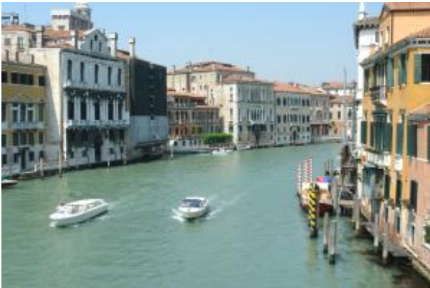
Zwei Taxis auf dem Canal Grande

Aufschlag gibt es auch bei den abseits gelegenen Hotels Hilton, San Clemente, Exelsior/Lido und wenn die Taxen in kleine inneren Kanäle hineinfahren müssen.